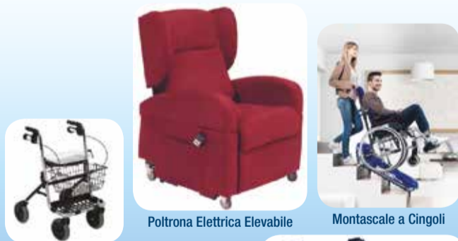
Deambulatore per esterno