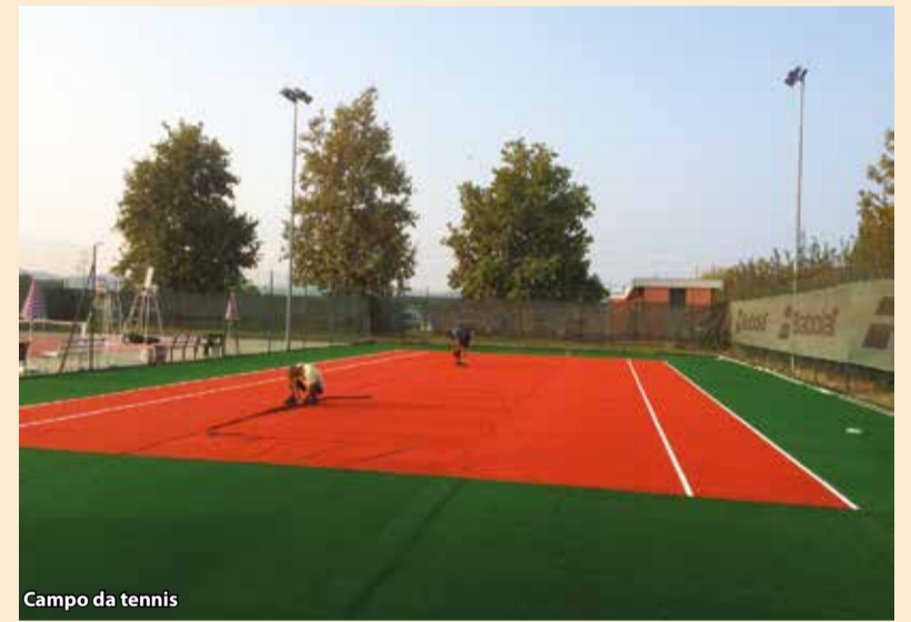
Campo da tennis