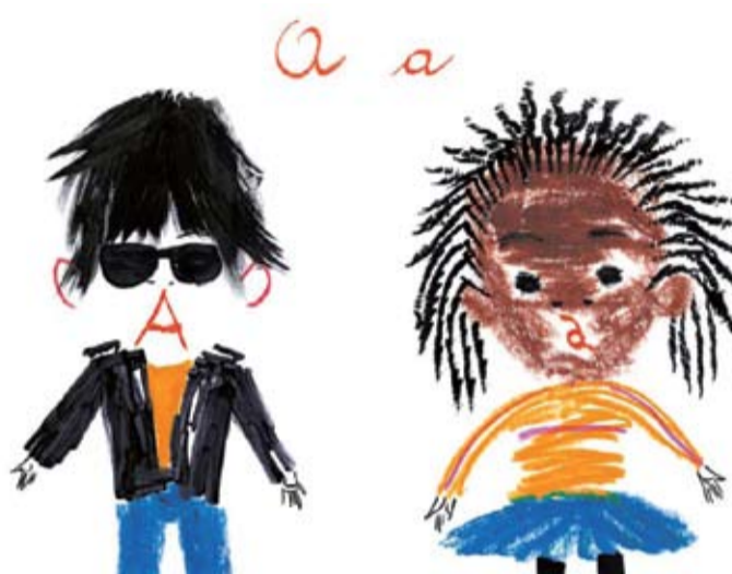
Illustrazione di A. Sanna