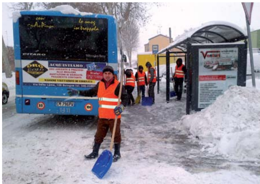
● Gruppo Progetto Verde

La straordinarietà dell'evento ha messo a dura prova il Piano neve del Comune e alcune zone ne hanno risentito più di altre, per esempio via Mazzoni e via Bosi. Qui la neve e le basse temperature crearono un strato di ghiaccio sul manto stradale, che abbiamo