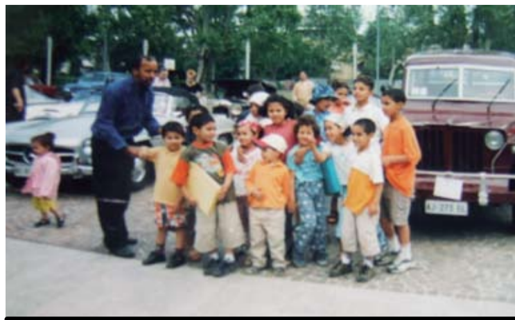
I primi bambini della scuola araba nel 2002