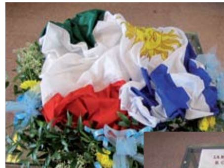
o La lapide celebrativa