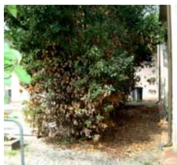
● Il Cimitero di Anzola