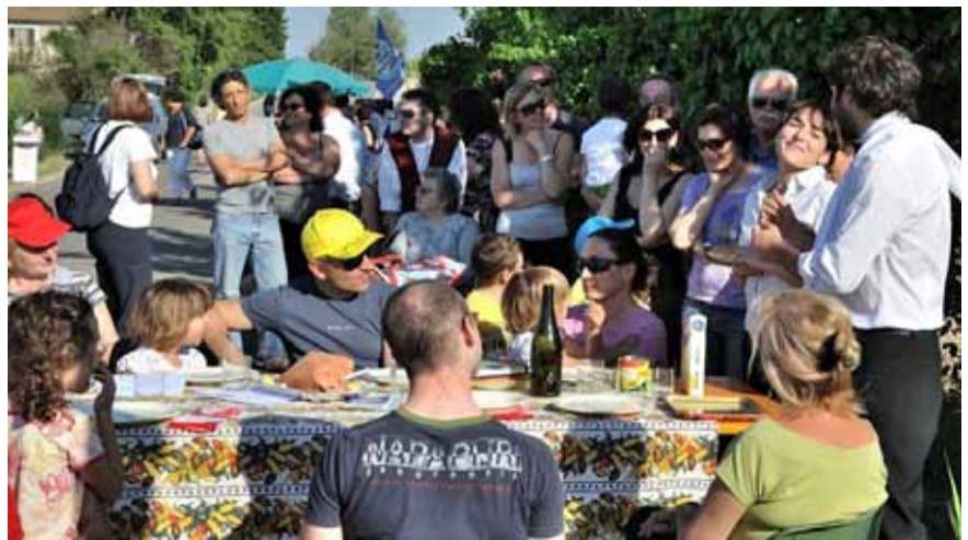
Festa in campagna di ambientiamoci del 8.5.2011