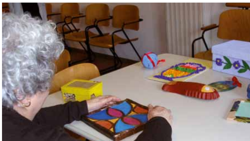
Attività al centro diurno

Come accedere Per accedere al servizio di assistenza domiciliare è necessario fissare un colloquio con l'assistente sociale che, insieme alla persona e alla famiglia, raccoglierà tutti gli elementi per valutare il bisogno e formulare il piano di intervento personalizzato.