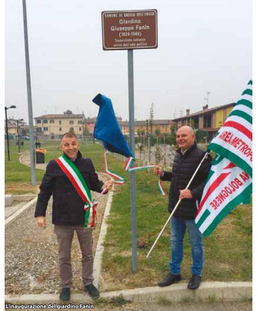
L'inaugurazione del giardino Fanin

erano presenti i famigliari di Fanin, autorità civili e religiose, i rappresentanti della Fuci, della Cisl, delle Acli, del Mcl e tanti cittadini. Sono stati ultimati i lavori di manutenzione straordinaria della palestra di via Lunga -Centro sportivo "Massimo Barbieri", è stata realizzata la manutenzione straordinaria del cimitero del capoluogo. Infine è stata fatta la manutenzione straordinaria di alcuni tratti critici di strade comunali e marciapiedi (Via Garibaldi, Via Alvisi nei pressi del ponte delle Budrie, Via Magenta, Via Mazzoni, Via Fiorini nei pressi della borgata Casetti, Via Emilia nei pressi della rotonda di Lavino di Mezzo, Via Sparate, Via Sghinolfi e marciapiede di Piazza IV Novembre).