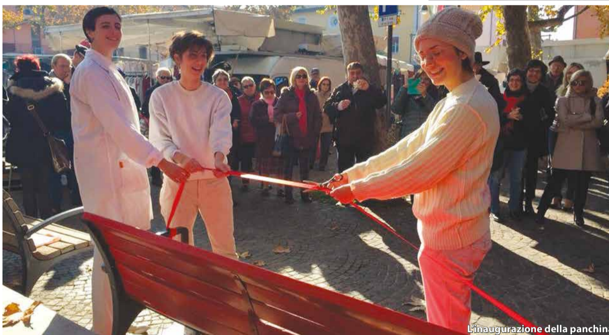
L'inaugurazione della panchina