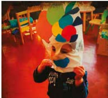
relazione alle vaccinazioni obbligatorie. Per informazioni: 051/6502222 http://www.bibliotecanzola.it/SPAZIOGIOCO-ludoteca-comunale

zioni dei libri, costruire con materiali diversi, imparare parole nuove, correre a perdifiato, travestirsi da mago, inventarsi un mondo colorato e pieno di amici. La Ludoteca si apre alla creatività, all'espressività, all'immaginazione, all'arte con piccoli laboratori per stimolare la manualità, la sensibilità, l'espressività personale. Al servizio si accede tramite iscrizione obbligatoria, effettuata da un genitore o da chi ne fa le veci, compilando un modulo per comunicare i dati necessari e firmando le dichiarazioni previste dalla normativa in