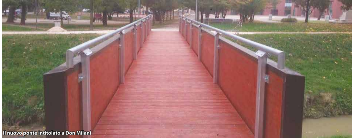
Il nuovo ponte intitolato a Don Milani

Abbiamo finalmente sostituito il ponte di legno sul Ghironda e, dal 20 ottobre, riaperto al passaggio ciclo-pedonale dei cittadini. Il 28 ottobre lo abbiamo intitolato a don Lorenzo Milani , insieme alle autorità civili e religiose, ai ragazzi e agli insegnanti della scuola media e a tanti cittadini. Abbiamo così concluso le iniziative organizzate per riflettere sulla figura di don Milani, uno dei sacerdoti più profetici del '900. Il ponte è opera pubblica simbolo di ciò che ha fatto don Milani: connettere i principi della Costituzione nata dalla Resistenza all'impegno per la scuola, l'educazione, la dignità degli ultimi. Il nostro ponte concretamente unisce il monumento al partigiano con la scuola media "Pascoli".