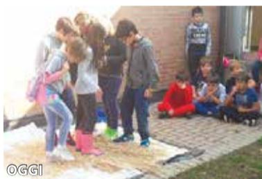
primaria per essere poi utilizzati per la realizzazione di un pannello artistico. Le insegnanti delle classi quinte della scuola primaria "Caduti per la libertà"