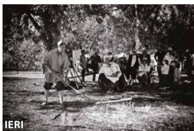
del Comune, erano il frutto del progetto "I semi delle civiltà" avviato nell'anno scolastico 2016/17 dalle classi quarte della scuola Caduti. I chicchi ricavati, ora sono conservati presso la scuola

Il 10 ottobre le antiche abitudini della civiltà contadina sono entrate a scuola. Gli alunni delle classi quinte si sono impegnati a battere i grani che avevano seminato a novembre 2016 e raccolti a fine giugno presso il museo archeologico di Anzola. I bambini hanno battuto con i loro piedi le spighe del grano moderno, del Senatore Cappelli e dell'avena per permettere ai chicchi di separarsi dalla pula. Un'operazione divertente che ha concluso il ciclo: dalla semina, al raccolto e alla battitura. Le spighe conservate durante l'estate nei magazzini