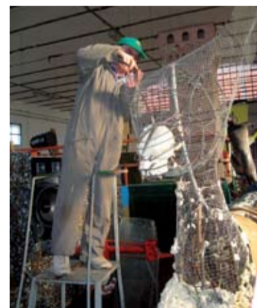
o Preparazione dei carri 2013

e-mail: biblioteca@anzola.provincia.bologna.it