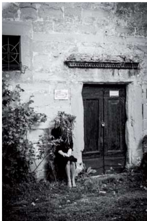
o Verso Terra