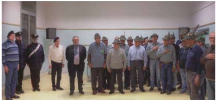
Alpini, carabinieri, bersaglieri e due carristi insieme