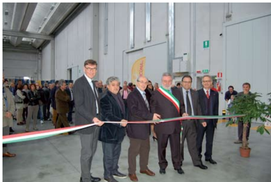
Taglio del nastro al Centro Nordiconad