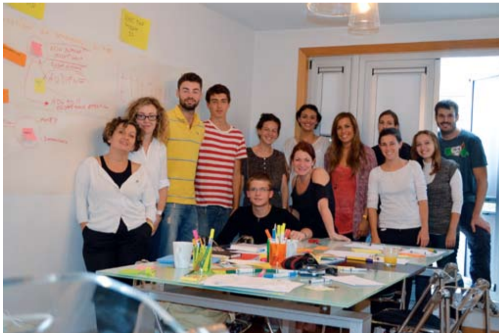
● Missione NyPaD in Spagna 2013