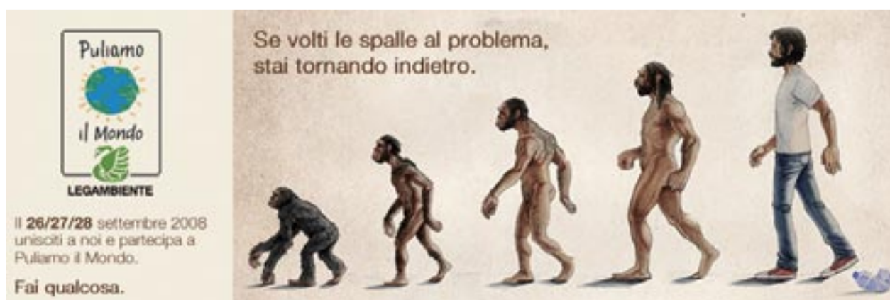
Manifesto campagna 2008 "Puliamo il Mondo"

Nel cimitero comunale di Anzola, negli ultimi anni, stavano diminuendo gli spazi disponibili per la conservazione dei resti mortali provenienti dalle esumazioni ordinarie dei campi comuni e dalle esumazioni dei loculi al termine del periodo di concessione. L'Amministrazione comunale ha pertanto realizzato tre nuovi blocchi di ossari (con struttura prefabbricata) all'interno della attuale struttura cimiteriale, con contenuti costi di esecuzione e ridotti disagi da cantiere. Complessivamente sono stati realizzati 128 ossari. Il cimitero del capoluogo necessita di altri interventi, in particolare del completamento dell'ala realizzata nell'ultimo ampliamento che saranno realizzati nel 2009 e di cui daremo puntuale informazione.