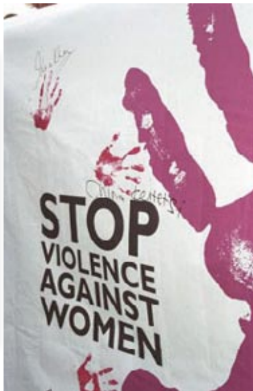
• Manifesto della campagna di Amnesty contro la violenza sulle donne.

Mai più violenza sulle donne presso la Sala Polivalente della Biblioteca in Piazza Giovanni XXIII ingresso gratuito