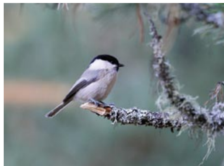
In alto, alcuni esempi di mangiatoie. A destra, dall'alto verso il basso un Merlo, un Pettirosso e una Cincia mora fotografati da Piergiorgio Serra.