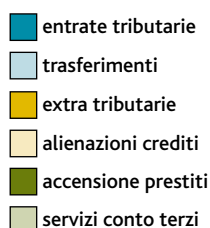
Fig. 1 La ripartizione delle entrate Il Bilancio di previsione 2009 prevede complessivamente 14.386.289,32 € di entrate.

Portare a compimento gli impegni di mandato