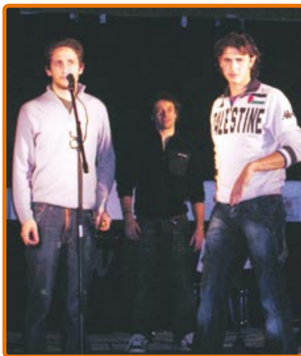
• Due momenti della serata Scorie Folk dell'8 novembre