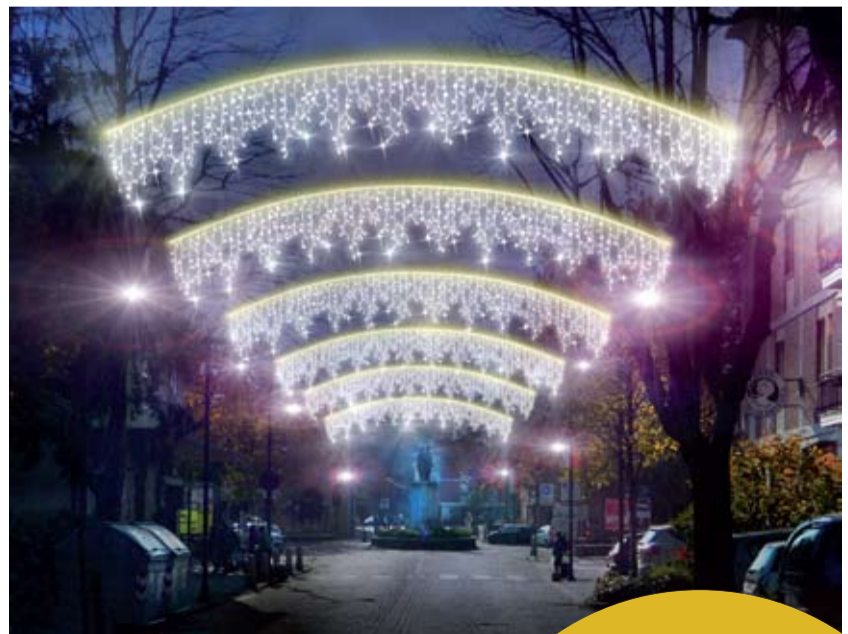
Elaborazione grafica Pirani Luminarie S.R.L.