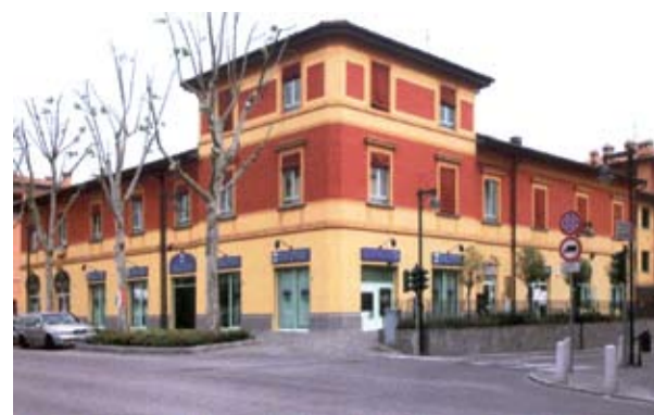
● Casa del Popolo

Sede Avis: P.zza Berlinguer 5, sabato ore 10.30 -11.30 mail: anzolaemilia.comunale@avis.it Centro Mobile c/o Poliambulatorio via 25 Aprile dalle 7,30 alle 10,30. Domenica 23 dicembre 2012 e domenica 20 gennaio 2013.