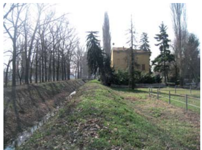
● Il futuro percorso lungo il torrente Ghironda