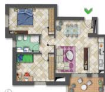
trilocale tipo A PARTIRE DA €184.700