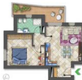
bilocale tipo A PARTIRE DA €134.700