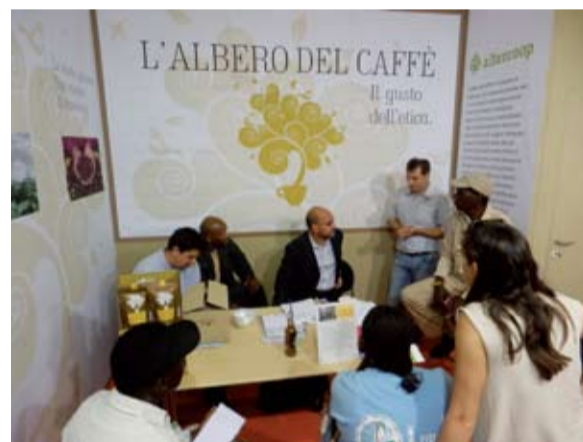
Albero del Caffè al SANA 2012