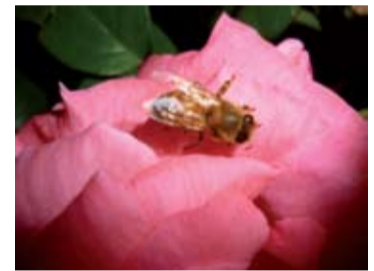
● Un ospite degli apiari di Guidi