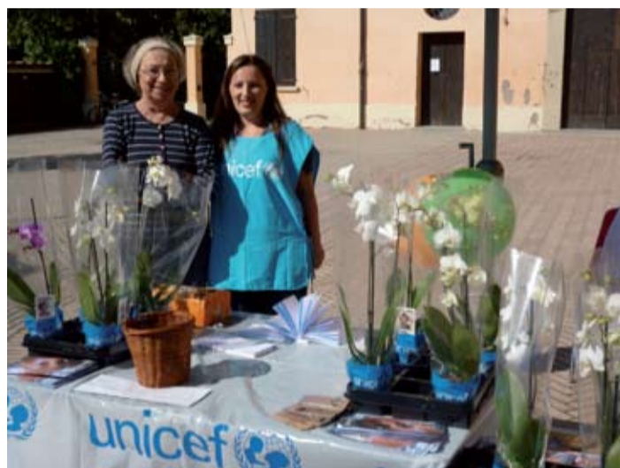
● Banchetto Anzola Solidale Unicef

sa scolastica del Comune di Anzola e le due scuole di Bologna che ogni venerdì ci permettono di ritirare frutta e pane da distribuire il sabato. Ringraziamo i numerosi volontari che di tanto in tanto hanno contribuito portando viveri da distribuire ma anche donazioni. Ringraziamo di cuore le fa-