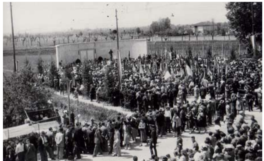
Inaugurazione monumento al partigiano - 7 maggio 1950. Archivio fotografico Istituto Parri