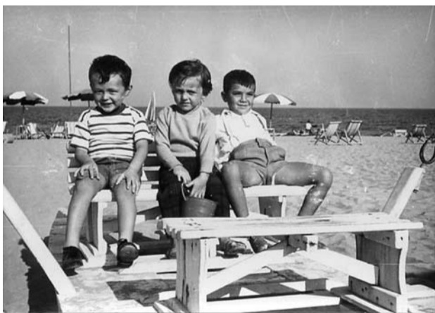
Bambini anzolesi in colonia anni '50.