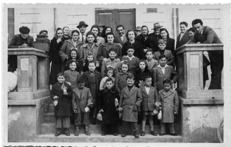
Bambini del sud Italia ospitati da famiglie anzolesi. Anni '50