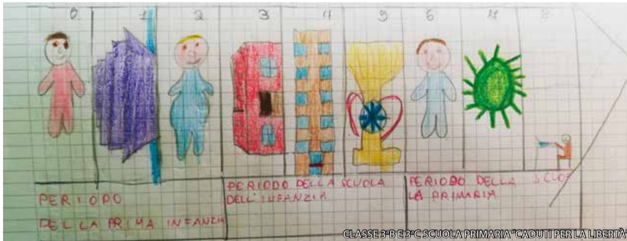
CLASSE 3-B E 3-C SCUOLA PRIMARIA "CADUTI PER LA LIBERTÀ"

Alcune frasi tratte da un lavoro della classe 4 della Scuola primaria "Arcobaleno" . Gli elaborati completi dei bambini accompagnati dai loro disegni, saranno esposti all'ingresso principale del Comune.