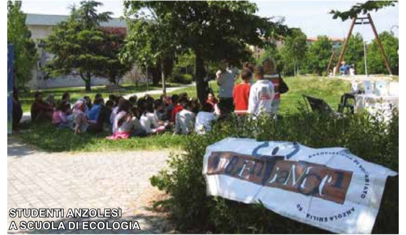
STUDENTI ANZOLESI A SCUOLA DI ECOLOGIA

Ambiente e società sono ambiti cari a noi di AMBIENTIAMOCI perché connessi. Fanno parte del nostro impegno e da oltre 30 anni, come volontari, divulgiamo e produciamo progetti ed azioni qualificate: servizi ambientali, raccolta differenziata, urbanistica, tutela del territorio e delle risorse naturali, sviluppo sostenibile, economia circolare, lotta allo spreco e attualmente gestiamo lo "Sportello alimentare".