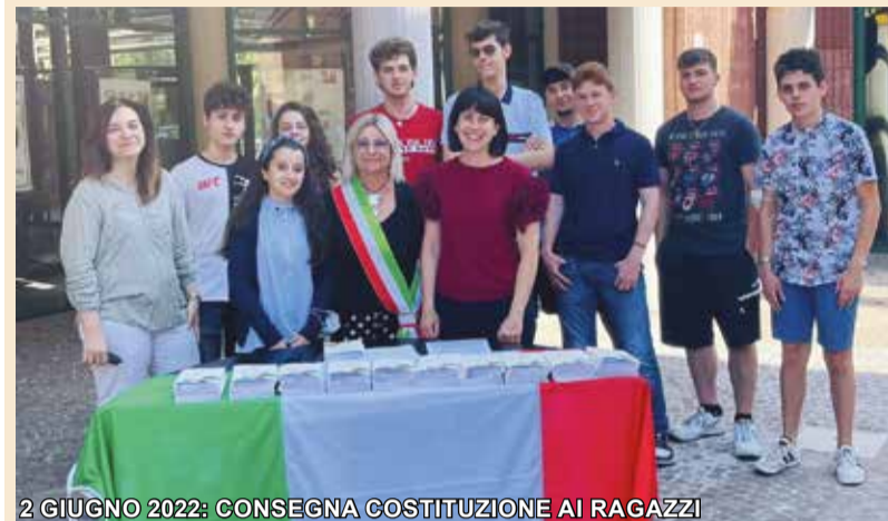
2 GIUGNO 2022: CONSEGNA COSTITUZIONE AI RAGAZZI