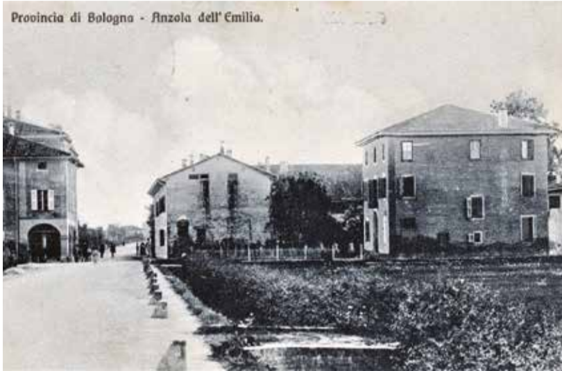
Provincia di Bologna - Anzola dell'Emilia.

Nelle elezioni comunali del 24 ottobre 1920 si votò anche ad Anzola con il sistema "maggioritario" che assegnava 16 consiglieri (su 20) alla lista che avrebbe ottenuto più voti, e 4 alla lista che sarebbe risultata minoritaria.