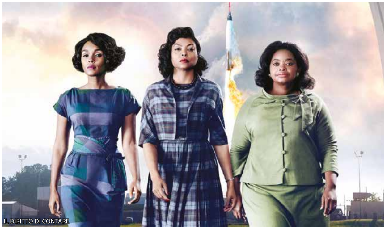
IL DIRITTO DI CONTARE

Sotto le stelle del cinema - Fili di parole torna dal 7 luglio a portare il grande cinema ad Anzola, a San Giacomo del Martignone, a Ponte Samoggia, a Lavino di Mezzo, nell'ormai consolidata location del Museo Carpigiani, per chiudere nella splendida cornice dell'antica Badia di Santa Maria in Strada. L'organizzazione della rassegna, a cura dell'Assessorato della Cultura e della Pro Loco di Anzola, si avvale del supporto indispensabile dei volontari di San Giacomo del Martignone, dei volontari della Parrocchia di Santa Maria in Strada, dei volontari per il Verde di Ponte Samoggia, dei volontari di "SIAMOANZOLA", del Centro Famiglie, dell'Associazione Amarcord, della Ca' Rossa. In cartellone titoli di esilaranti commedie italiane,